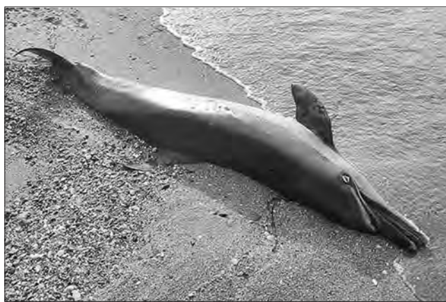
Мертвий дельфін-білобочка, якого знайдено влітку на українському узбережжі Чорного моря.

У 2022-му Міжнародний день Чорного моря, який із 1996 року відзначається 31 жовтня, практично опинився на задвірках наукового й суспільного життя шести держав, що входять у басейн Чорного моря. Причина — агресивні, божевільні дії чорноморського флоту росії в акваторії Чорного моря.